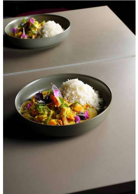
KOCH Richard Rauch Kürbiscurry mit Duftreis