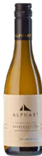
Weingut Alphart 2020 Beerenauslese