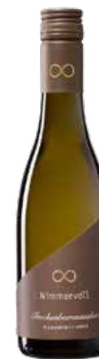
Weingut Nimmervoll 2021 Weißburgun- der Trockenbee- renauslese